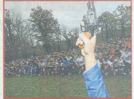
Sport scolaire P.3 UNSS: 5 673 licenciés à travers le département