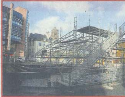
Rodez P.7 La Ville met en place ses animations pour Noël