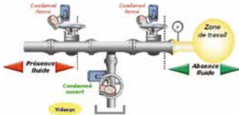
Figure 1 : Dimensionnement suffisant de la vidange pour éviter un colmatage (cas de fuite).